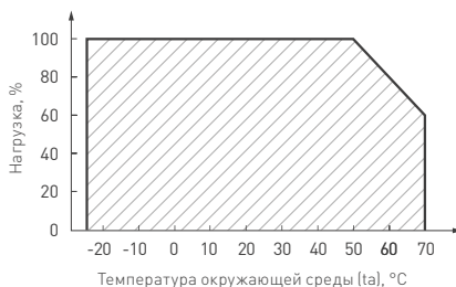
Рис. 2. Максимальная допустимая нагрузка, % от мощности источника.