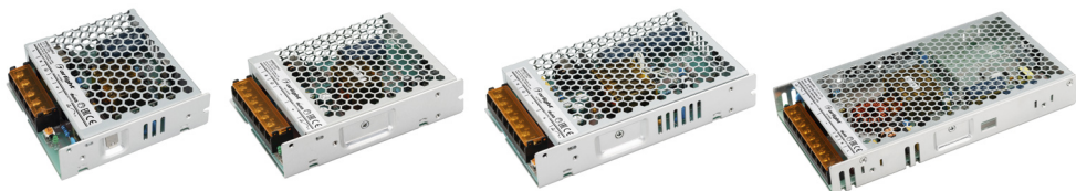
JTS-50-12FA JTS-75-12FA JTS-50-24FA JTS-75-24FA