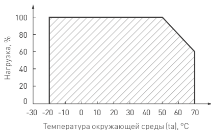
Рисунок 2. Максимальная допустимая нагрузка, % от мощности источника.