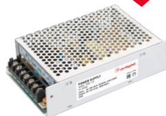
ARS-150 ARS-200 ARS-250